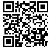
申込みフォームQRコード

お申し込み期日：2019年6月末日まで 広告協賛原稿提出期日：2019年7月10日まで お申し込み方法：協賛申込書を宛先までお送りください。